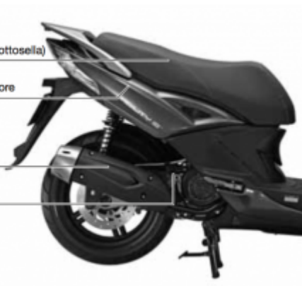
Astina controllo olio