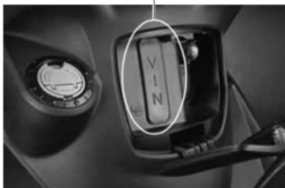
Connettore di diagnosi